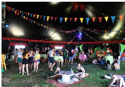
Festival La Nuit de l'Erdre, Yves Gruais