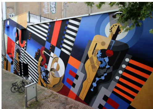
« Hommage à Métropolis » par Loutsider et Dinovoodoo Façade du Katorza, Nantes, 2017

L'association Plus de Couleurs a pour principal objectif de démocratiser l'art urbain et ses diverses pratiques en développant la présence d'oeuvres dans l'espace public et en favorisant la rencontre avec le public. L'événementiel prend une place importante avec l'organisation de temps forts comme la biennale Teenage Kicks et Le Mur Nantes. L'association travaille également en lien avec le milieu éducatif et associatif en proposant des ateliers (Écoles, ITEP, ESAT, maisons d'arrêt...).