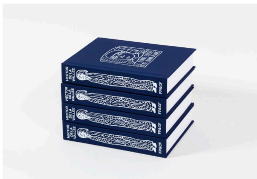
Hector de La Vallée, Le monde existe même quand je dors Editions FP&CF