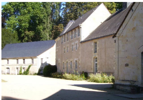
Les Moulins de Paillard, extérieur