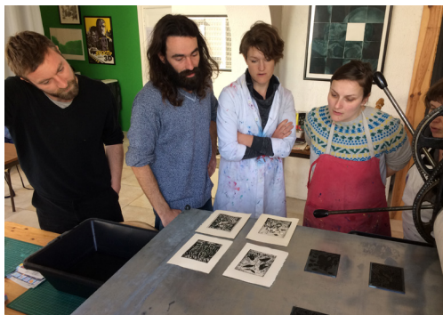
Initiation à la gravure et à l'estampe contemporaine, Ouououh