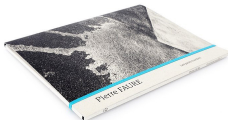
Pierre Faure, Les jours couchés, Sur La Crête Editions