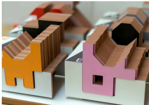
Le système graphique d'ALPHAbula©