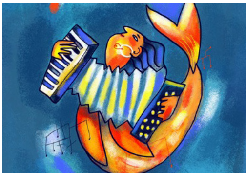
Chloé Mayoux, détail d'une illustration pour une carte à jouer du Jeu de Sept familles / Editions Vagnon, Groupe Fleurus