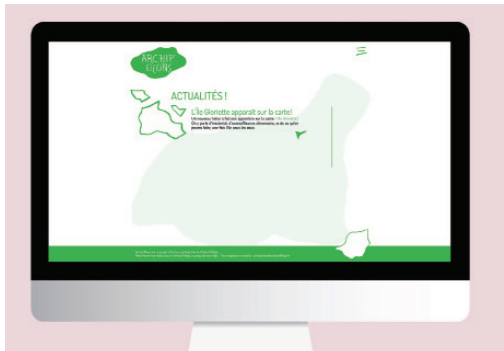
Image de la plate-forme Archip'Olons

Le Collectif 8h30 est un espace de création et de production d'objets imprimés. Les projets vont de la micro-édition aux plates-formes numériques, avec toujours l'ambition de proposer des supports physiques, facilement partageables, diffusables dans des lieux, spécialisés ou non. Le point commun entre toutes leurs actions réside dans un sujet central : le lieu.