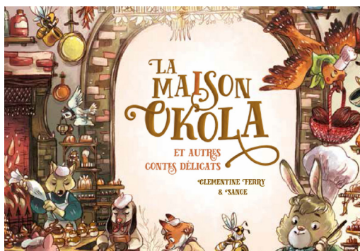
Détail de la couverture du livre "La Maison okola" de Clémentine Ferry et Sanoë. Editions du Lumignon