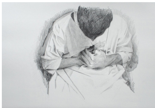
Jérémy Segard, dessin issu de la série "Vivre ou vivre mieux ?"