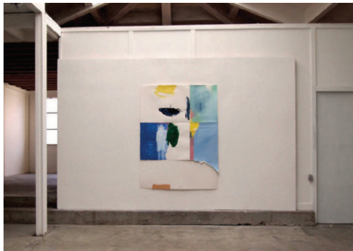
Romain Le Badezet, Sans titre (assemblage de chutes #4), papiers assemblés, 158 x 118,5cm (irrégulier), Nantes, 2020

Romain Le Badezet est un artiste plasticien. Installé à Nantes, il travaille au sein de l'Atelier Prisme. Utilisant le dessin, la peinture ou la sculpture, les formes qu'il crée sont construites au gré d'expérimentations plastiques variées. La récupération de matériaux est souvent le point de départ aux différents travaux de l'artiste. Il utilise des chutes de matériaux provenant de l'atelier lui-même, mais aussi des emballages industriels, des pages de magazines et autres rebuts et supports imprimés trouvés dans son environnement.