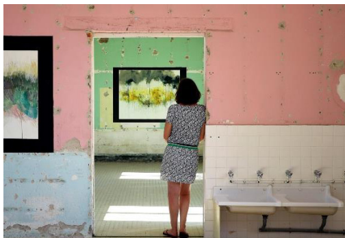
Exposition E. Wadecki, été 2019.

La Bernitude est un lieu de vie, de création artistique et de projets participatifs et solidaires abrité dans une ancienne école de la Bernerie-en-Retz. L'association accueille des artistes en résidence en leur mettant à disposition un hébergement et des espaces de travail. La programmation de la Bernitude relie territoire, production artistique et habitants. La bernitude est aussi un outil pédagogique d'éducation artistique et culturelle pour les plus jeunes.