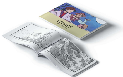
L'égaré - Rémy Pennarun, Patayo Editions